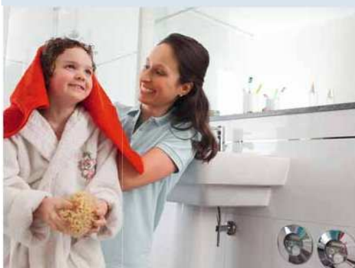
Elegantní a precizní: vodoměr Techem