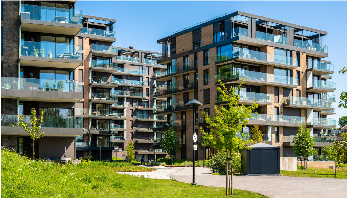
Lilleaker Vest Boligsameie